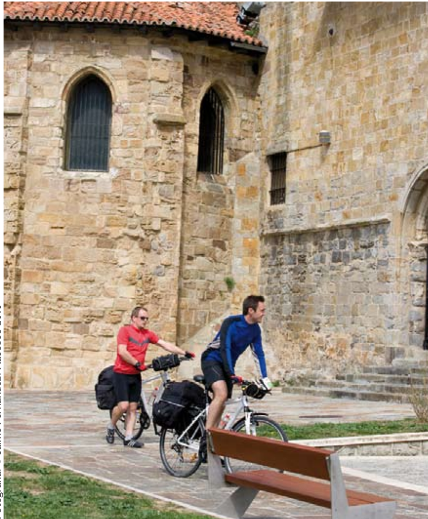
Fotografía: © Jaime Fernández. Xacobeo 2010