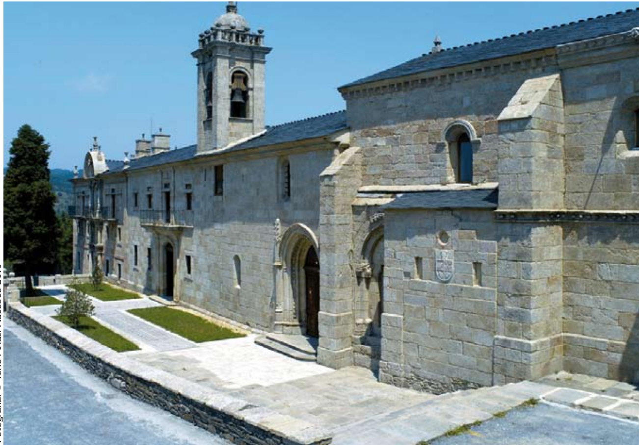
Fotografía: © Tono Arias. Xacobeo 2010