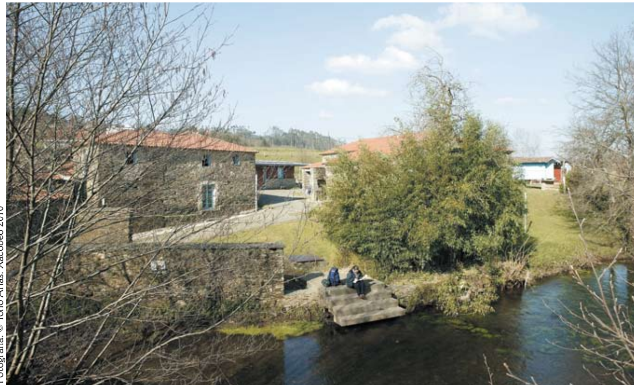
Xacobeo 2010