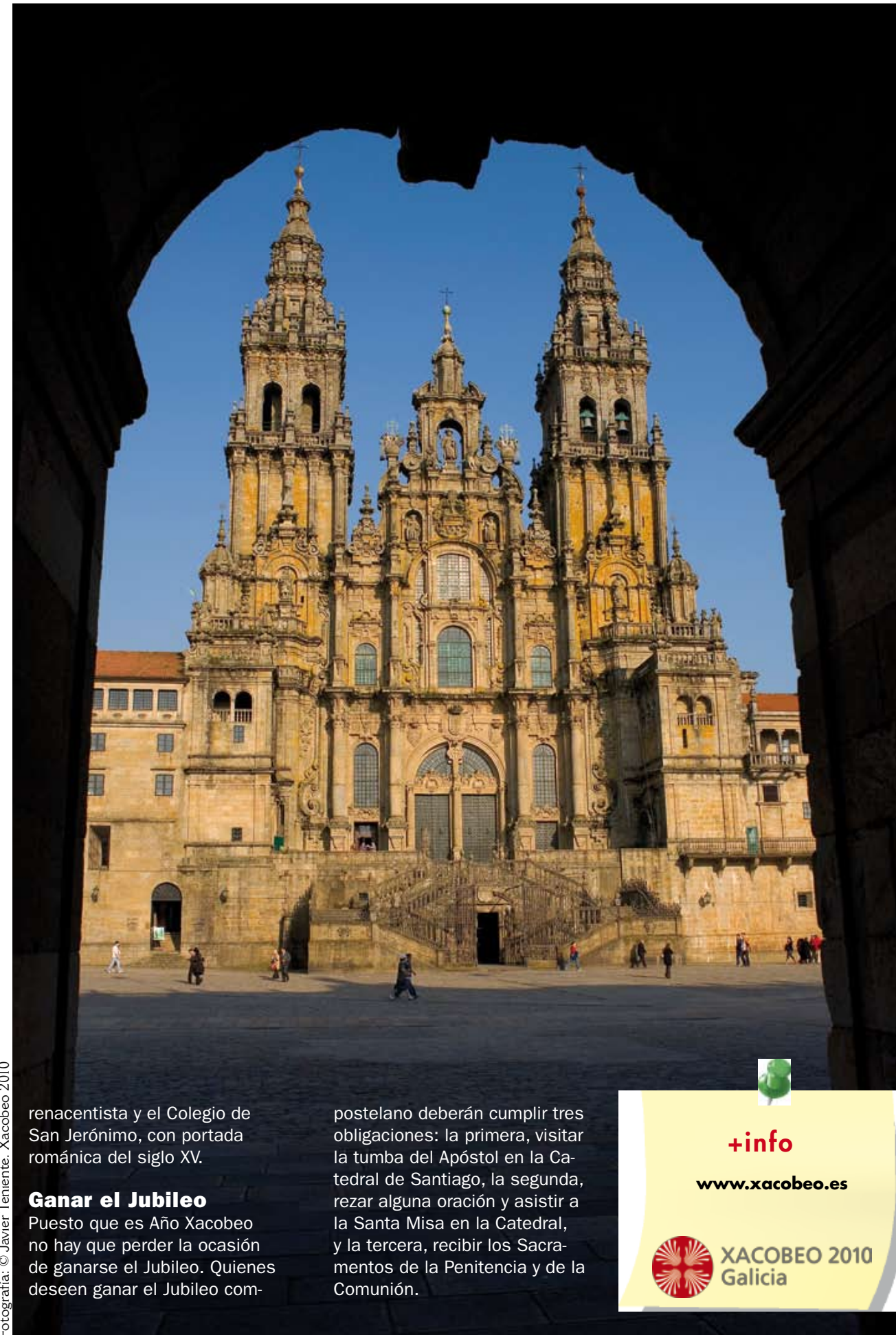
Fotografía: © Javier Teniente. Xacobeo 2010

en el Monte del Gozo, a unos tres kilómetros de la ciudad y a 368 m de altitud, desde el que los caminantes contemplaban por primera vez las torres de la catedral compostelana. Pero en cualquier caso, todas las vías llevan hasta la plaza del Obradoiro, centro geográfico y espiritual de esta ciudad milenaria. Si algún sentido tiene esta enorme plaza, sin jardines, ni bares, ni casas, es ensalzar la catedral con su fachada barroca a la que invita una enorme escalinata. Frente a la Catedral, el Palacio de Raxoi, neoclásico y convertido en Ayuntamiento y Presidencia de la Xunta, el Hostal de los Reyes Católicos,