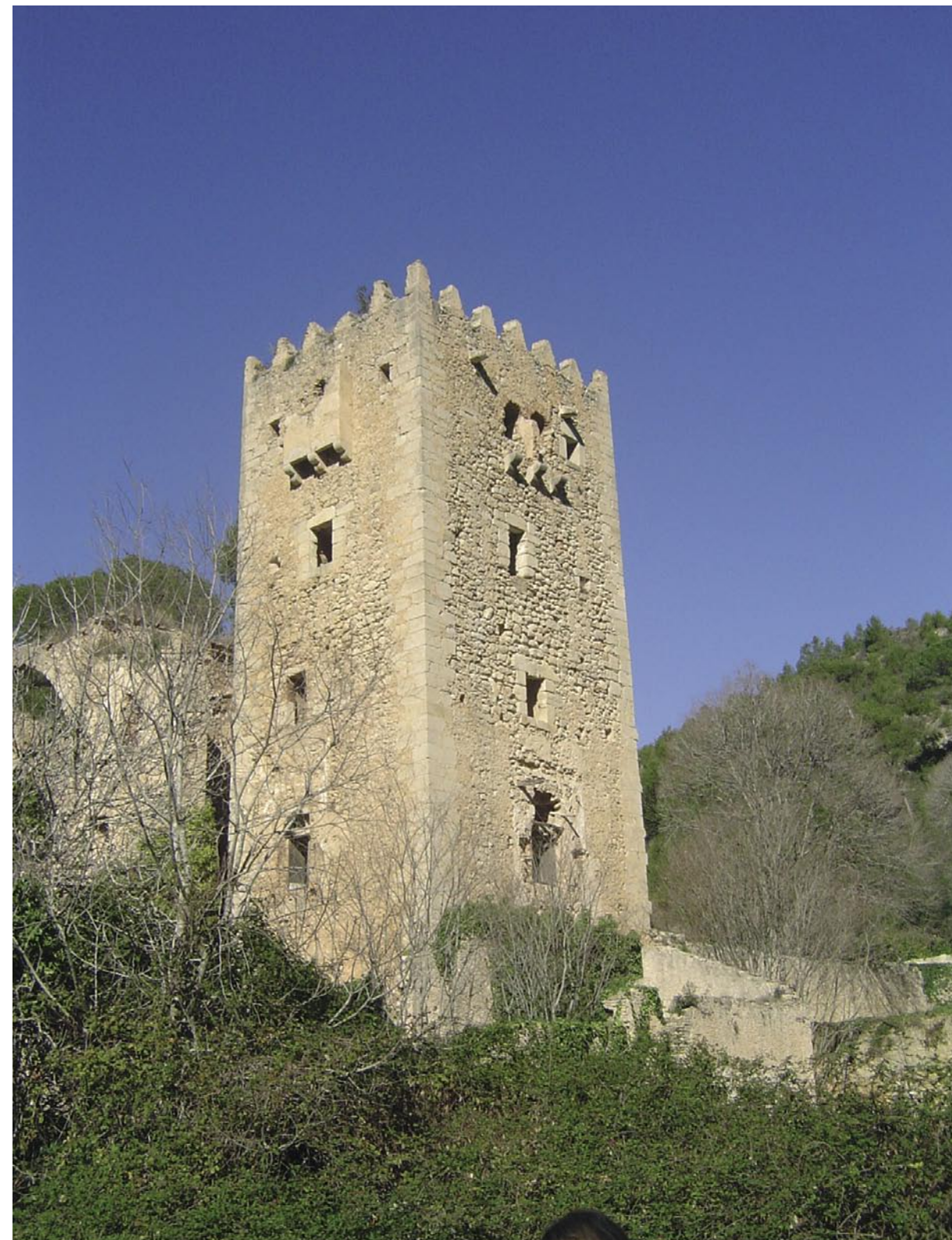
Torre dels Coloms del Monasterio de Santa María de la Murta, "Faro del Peregrino". Su época de mayor esplendor tuvo lugar en los siglos XV y XVI cuando se construyó la Torre y la Iglesia bajo el patrocinio de la familia

Los monasterios eran, por muchas razones, frecuentados por nobles, estudiosos, mercaderes, o penitentes, que acudían a ellos para hospedarse en sus tranquilas y limpias celdas huyendo de las bulliciosas y sucias fondas; o bien visitar los panteones familiares; otros consultar los fondos bibliográficos donde se conservaban valiosos manuscritos; o pedir el sabio consejo de los prudentes monjes, o la confesión y salvadora absolución de sus santos moradores; o para conseguir del prior sus favores en importantes transacciones económicas; y los más necesitados para pedir trabajo,